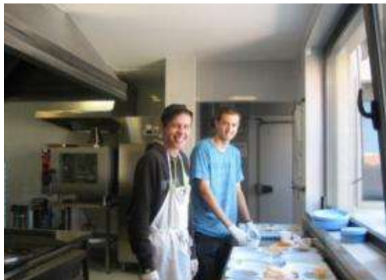
Voluntarios colaborando nas tarefas de comedor

Ó longo de todo o ano, o Centro de Desenvolvemento Rural “O Viso” conta coa