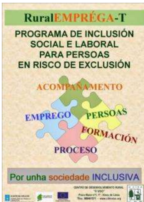
Cartel informativo do programa

O Centro de Desenvolvemento Rural “O Viso”, puxo en marcha en outubro o programa RURAEMPREGA-T, en colaboración coa Consellería de traballo e benestar