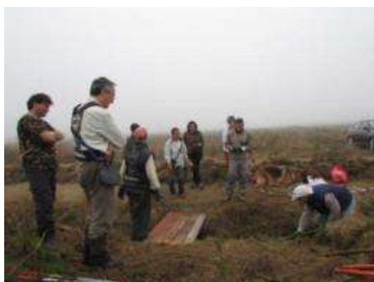
Traballos desenvolvidos no marco da programa

O C.D.R. "O Viso" participou no Programa de investigación para a recuperación da fauna e flora nas veigas de Lososelo-Vilaseca, en colaboración coa Sociedade Galega de Historia Natural (SGHN).