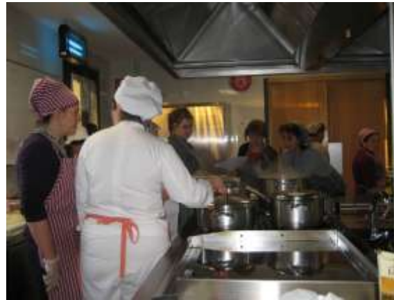
Imaxes de actividades do curso