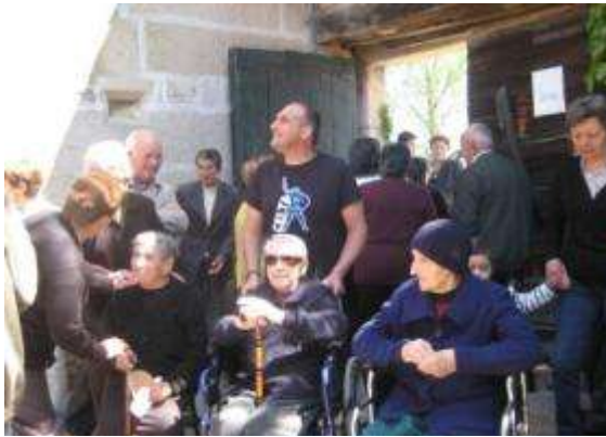
Veciños e veciñas participando nunha actividade

Celebración de festas e costumes populares, día das persoas maiores, carnaval, magosto, etc... Nestas celebracións participaron preto de 250 veciños e veciñas.