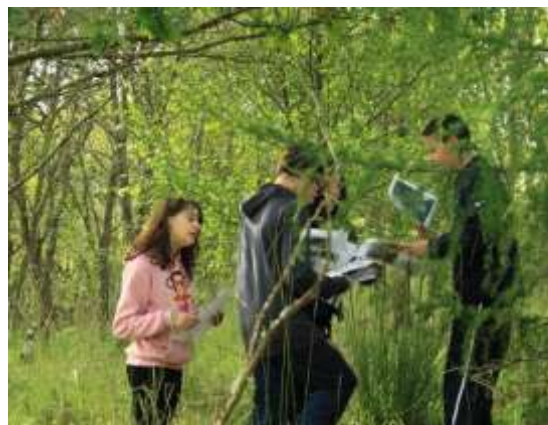
Imaxe dos/as participantes en plena actividade

O logro xeral destas xornadas de convivencia é que os nenos/ás e mozos participantes comprendesen o problema ambiental que producen os lixos domésticos e que aprendesen como poden contribuír a solucionalo. Ademais tamén se tratou de mellorar o seu coñecemento sobre o medio natural máis inmediato. Coñecer as técnicas básicas de compostaxe, para a transformación dos residuos orgánicos en compost. Tívoise en conta que a maioría dos asistentes proveñen do medio rural polo que están familiarizados co subscriutor e os procesos de descomposición do esterco.