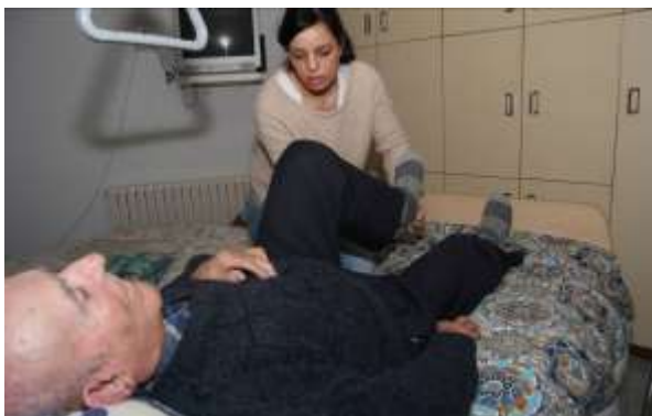
Servizo de rehabilitación a domicilio