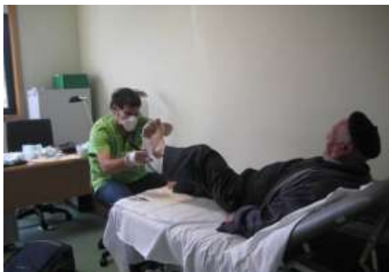
Servizos de podoloxía e comedor a domicilio

Co obxectivo de que os nosos maiores poidan permanecer no seu fogar, e cunhas mellores condicións de vida, dende o CDR “O Viso”, ofertáronse os seguintes servizos para aquelas persoas maiores e as súas familias e persoas cuidadoras: