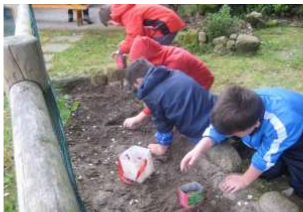
Participantes nos distintos obradoiros