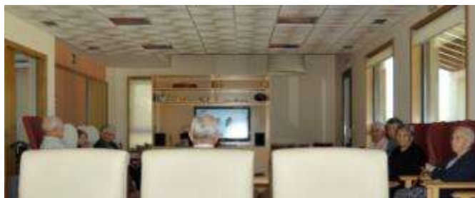
Actividades diarias no Centro de Día Lodoselo