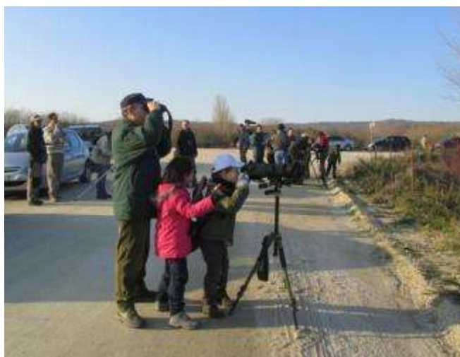
Cartel das xornadas e participantes nas mesmas