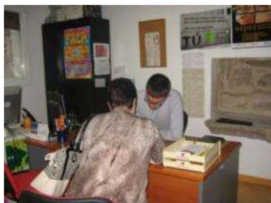
Imaxes do obradoiro e dunha entrevista de orientación e acompañamento

O programa ten continuidade no ano 2014, e nos meses de novembro e decembro de 2013 contou coa participación de 37 persoas