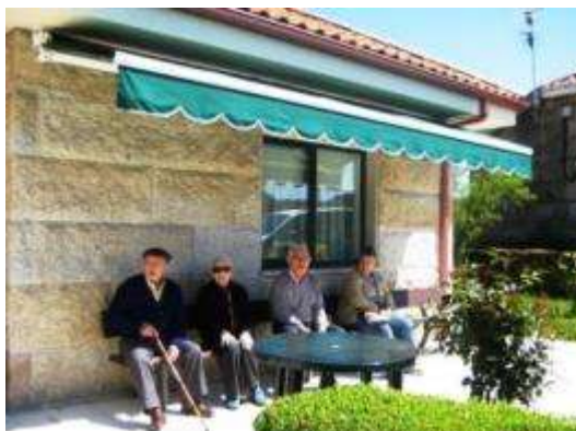
Residentes da vivenda comunitaria

Co ánimo de que as circunstancias non obriguem ás persoas maiores ó abandono do seu lugar de referencia na súa existencia: a súa casa, a súa xente, o seu pobo... o Centro de Desenvolvemento Rural "O Viso", apostou por un modelo de convivencia que se