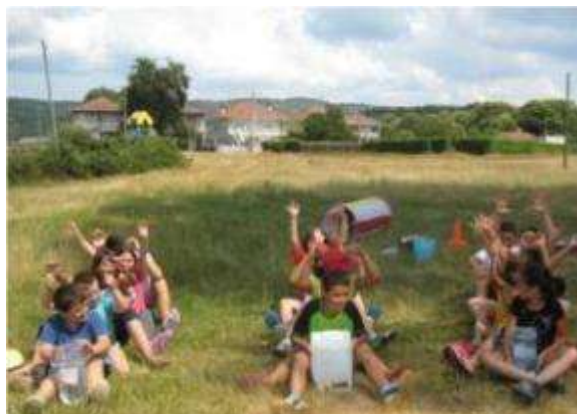
Participantes no campamento de verán