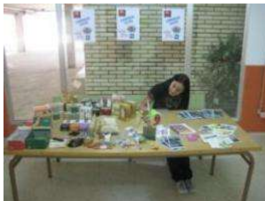
Mesa informativa comercio xusto