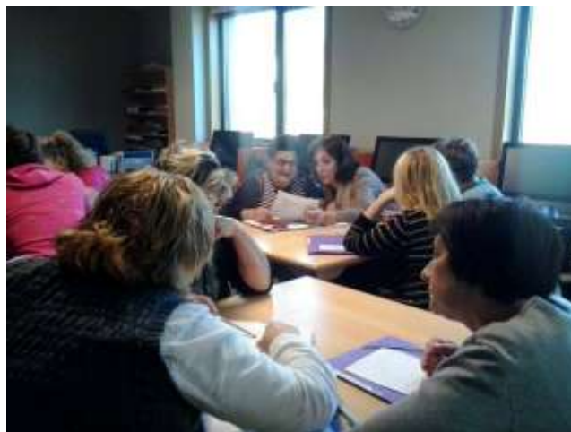
Participantes no curso

No mes de novembro, impartíuse nas instalacións do C.D.R. "O Viso" o curso "Características e Necesidades de Atención Hixiénico Sanitarias das Persoas Dependentes.", o que asistiron 12 persoas. Con este curso quíxose ofertar unha formación específica a persoas con dificultade de inserción, especialmente a mulleres e xente