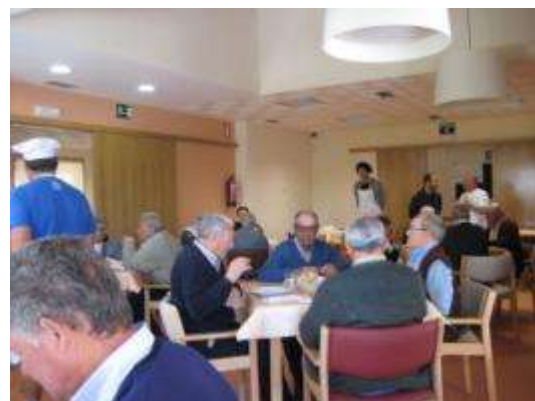
Actividade diaria do comedor social