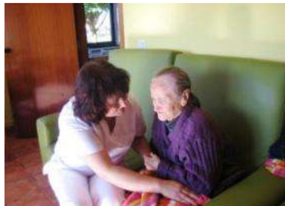
Unha das participantes das prácticas na vivenda