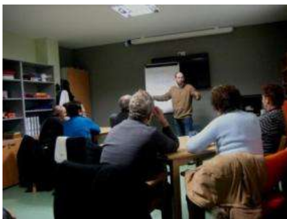
Participantes no taller de memoria

Neste ano levouse a cabo un taller de estimulación para a memoria para os/as veciños e veciñas da bisbarra. Nel participaron un total de 15 veciños e veciñas.