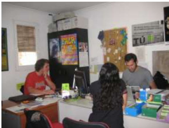
Oficina do Centro de Información Xuvenil

O obxectivo do CIX da Limia é achegar á sociedade Limiá todas aquelas informacións que poidan ser de interese e utilidade, así como facilitar o acceso a axudas, subvencións e outros recursos que poñen en marcha as diferentes administracións. Desta forma o CDR O Viso, a través do CIX da Limia, pretende facilitar a toda a comunidade, especialmente á