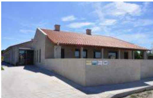
Entrada principal do Centro de Día

O Centro de Día "LODOSELO" é un centro xerontolóxico socio-terapéutico e de apoio