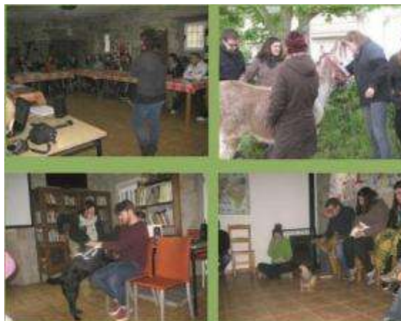
Imaxes do curso

Os días 17, 18 e 19 de maio realizouse en Lodoselo e dentro do Plan de Formación da Dirección Xeral de Xuventude e Voluntariado, o curso de Educación e Terapia Asistida con animais de granxa. 25 mozos/as das catro provincias galegas tiveron a posibilidade de poder realizar este curso organizado pola Escola de Tempo Libre "Limicorum" do C.D.R. "O Viso". O curso foi impartido en colaboración con Humanymal, organización especializada na implantación e xestión de programas de terapia e educación asistida con animais.