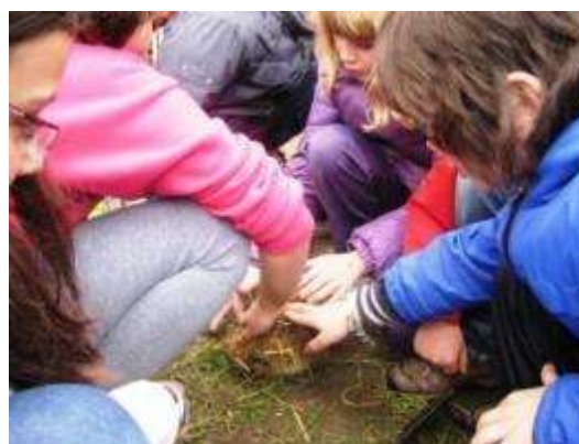
Nenos e nenas no obradoiro do pan e cos animais

esquecemento do acervo cultural nos nosos pobos e aldeas, oferta dende 1.994 unha achega de coñecemento vital da realidade rural: entorno natural e humano, modos de vida,... Nesta actividades se desenvolven obradoiros que poñen en contacto os visitantes co medio rural e coas tradicións populares galegas.