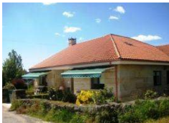
Vista da vivenda comunitaria A túa outra casa